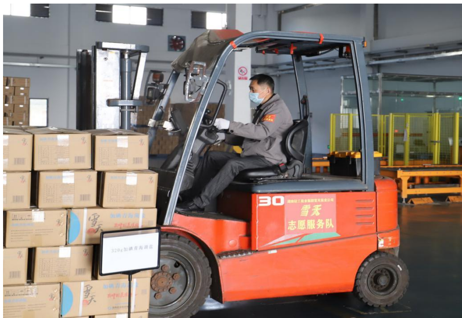
雪天志愿者在行动

艰的良好氛围。设置“抗疫保供雪天群英谱”专栏，及时报道和推广各单位在疫情期间的好经验、好做法，为全体干部职工统一思想、凝聚共识、共同打赢疫情防控阻击战发挥了积极有力的舆论引导作用。