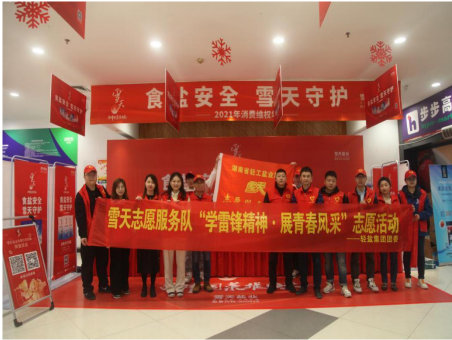
雪天志愿者开展学雷锋活动

们通过打扫消杀、为社区老人送粮油蔬菜、利用周末时间值守市场、深入社区内的住宅小区进行上门摸排和信息登记等多种形式，努力在疫情防控工作中传递温暖、贡献力量。