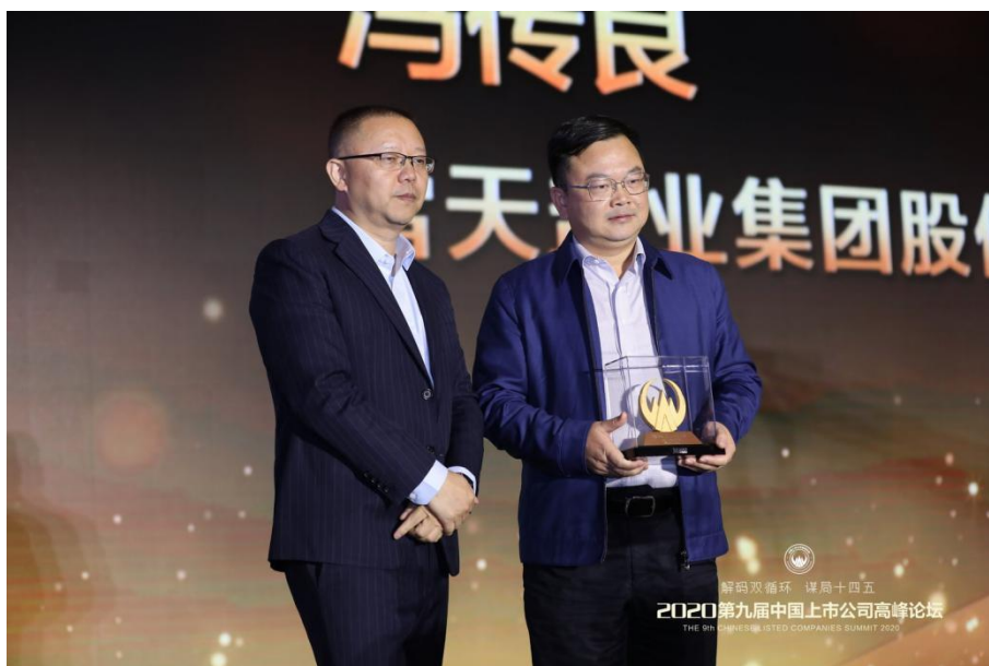
荣获第十届中国上市公司口碑最佳上市公司董事长奖

公司成立了风险管理委员会，制定了风险管理委员会工作规则、重大风险事项管理细则、风险点 A、B、C 分类梳理和应对措施等风险管理制度。以全面风险管理为导向的企业内部控制规范的实施，提升了企业管理水平，保护了投资者合法权益，保证了公司发展战略的实现，促进了公司的可持续发展。