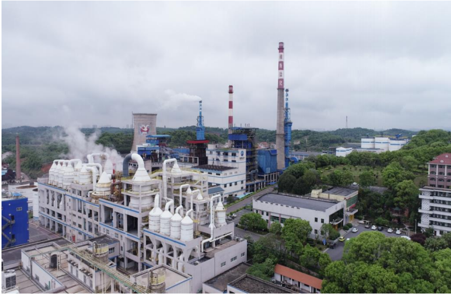
制盐企业实现超低排放